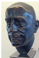
Büste Wilhelm Leuschners beim DGB-Bundesvorstand