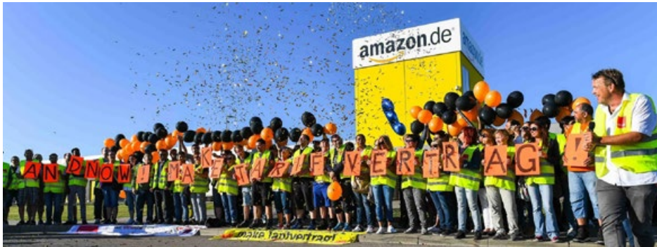
Immer wieder machen die Beschäftigten mit kreativen Aktionen auf ihre Forderung aufmerksam: Wir wollen einen Tarifvertrag! Hier im September 2017 am Augsburgster Standort.

Seit Jahren kämpfen die Beschäftigten beim größten Internethändler der Welt für eine angemessene Bezahlung und bessere Arbeitsbedingungen. Amazon blockte bisher alles ab. Doch die KollegInnen lassen sich nicht entmutigen. Langsam bewegt sich der Internetriese.